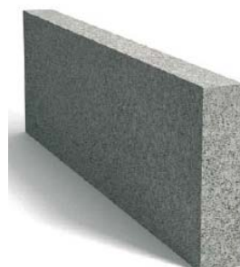
Tablica 1. Wymiary obrzeży.