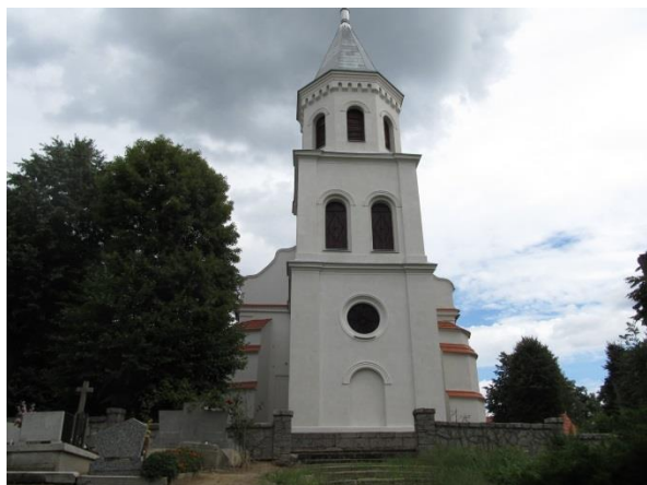
Kościół parafialny w Strzelcach Wielkich