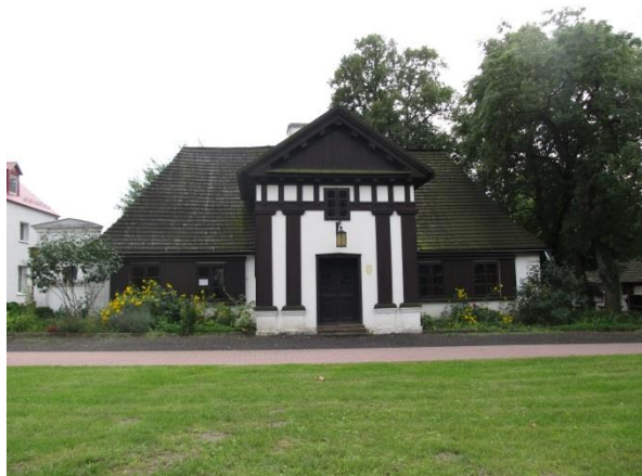
Dwór w Grabonogu.

Dawny zajazd (obecnie dom nr 66) usytuowany jest przy rozwidleniu dróg prowadzących z Gostynia i Świętej Góry w kierunku południowym do Grabonogu i Podrzecza. Wybudowany został w 1 poł. XIX w. Jest murowany, parterowy, kryty dachem naczółkowym. Wnętrze przebudowane. Pierwotnie na osi była sień, a po jej bokach duża izba i gościnne pokoje.