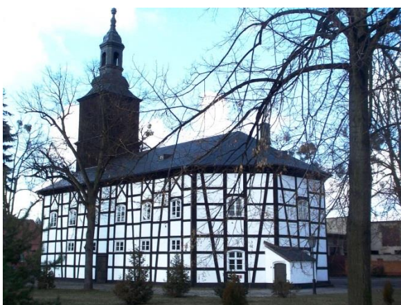
Kościół poewangelicki w Piaskach.

Ewangelicki zbór okala dawny ementarz przykościelny , użytkowany do 1945 r., później przekształcony w park. Wzdłuż jego zachodniej granicy zachował się fragment zabytkowego ceglanoego muru ogrodzeniowego z bramą.