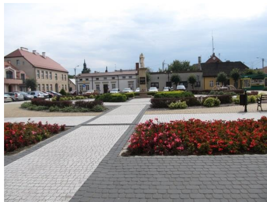
Rynek w Piaskach wczoraj (lata 50-te XX w.) i dziś (2017 r.)

Stała dbałość o wspólną przestrzeń jest ważnym aspektem działalności Gminy. Zadbane otoczenie jest istotne zarówno dla mieszkańców miejscowości i gminy, ale także dla przejeżdżających i turystów.