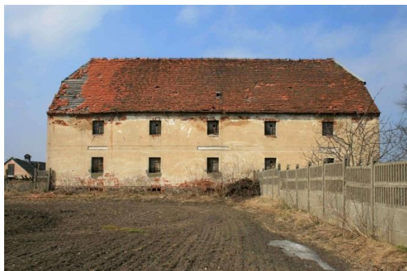
Spichlerz w Bodzewku Drugim

Na zachód od pałacu rozciąga się niewielki park o charakterze krajobrazowym. Zadrzewienie parkowe występuje wokół jego granic, w centrum parku rozległa polana. W starodrzewie parkowym występują dęby, lipy i kasztanowce.