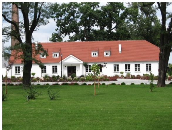
Dwór w Szelejewie