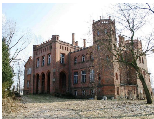
Pałac w Podrzeczu

Na zachód od zespołu pałacowo-parkowego, za drogą, mieściła się kolonia mieszkalna pracowników folwarcznych. Dwa domy, nr 4 i 5 , zostały objęte ochroną konserwatorską. Budynek nr 4 (dwojak) murowany, otynkowany, parterowy z użytkowym poddaszem. Kryty dachem czterospadowym, uskokowym z wysuniętym okapem i wycinanymi kroksztynami. Na osi fasady drewniany ganek w formie trójkolumnowego portyku wspierającego oszalowany szczyt. Budynek nr 5 (czworak) murowany, parterowy, z użytkowym poddaszem, otynkowany. Kryty dachem mansardowym z wysuniętym okapem na wycinanych kroksztynach. W dachu od frontu wystawka zamknięta trójkątnym szczytem; po bokach w dolnej połaci dachu okna powiekowe. Oba budynki powstały na pocz. XX w. i są świadectwem charakterystycznego dla tego okresu „stylu dworskowego” w budownictwie.