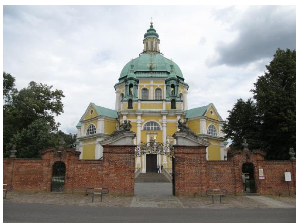
Sanktuarium Matki Bożej Świętogórskiej Róży Duchownej.