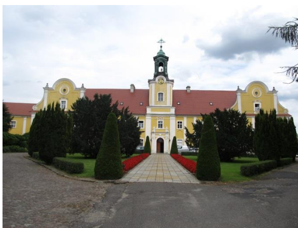
Klasztor filipinów na świętej Górze