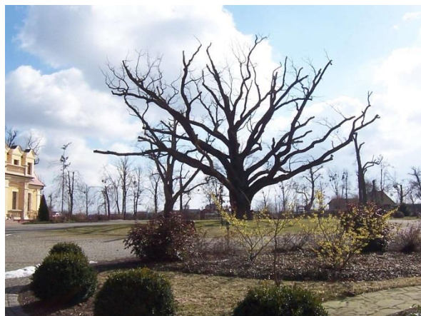
Park pałacowy w Godurowie