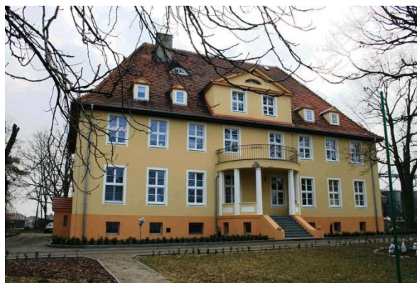
Pałac, ob. Dom Dziecka w Bodzewie