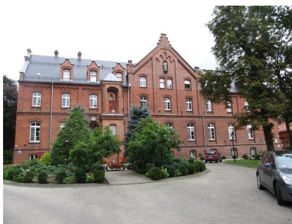
Szpital OO. Bonifratrów w Piaskach-Marysinie