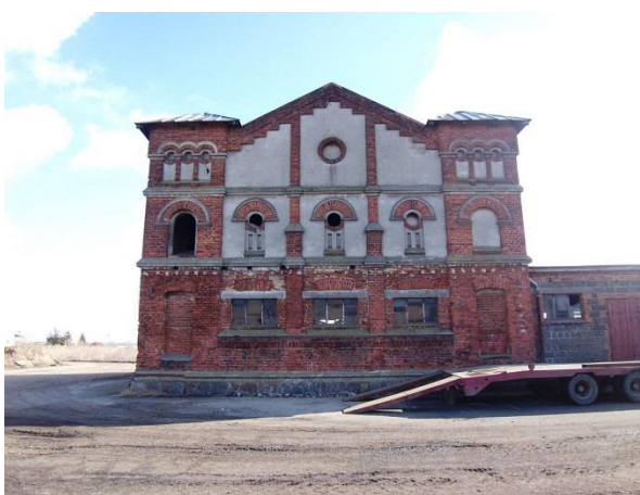
Spichlerz w Smogorzewie