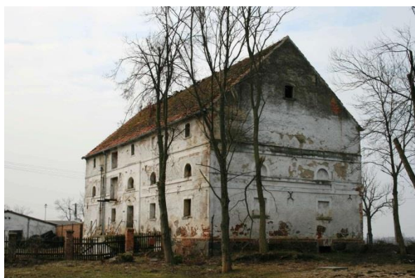
Spichlerz z 1850 r. w Bodzewie

dachem dwuspadowym krytym papą. Murowany, z cegły, o wążku krzyżowym, nieotynkowany. Stropy drewniane, wsparte na 2 rzędach stolców. Podłogi drewniane, deskowe, schody drewniane z balustradami. Otwory okienne zamknięte odcinkiem łuku. Okna dwuskrzydłowe, okratowane. Wrota drewniane dwuskrzydłowe, zamknięte odcinkiem łuku. Brył budynku zwarta, prosta. Elewacja szczytowa gładka. Kondygnacje wydzielone gzymsami. Obiekt w swojej bryle, rozwiązaniu elewacji i detalach architektonicznych jest typowy dla XX-wiecznej zabudowy folwarcznej.