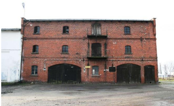
Spichlerz z 1908 r. w Bodzewie