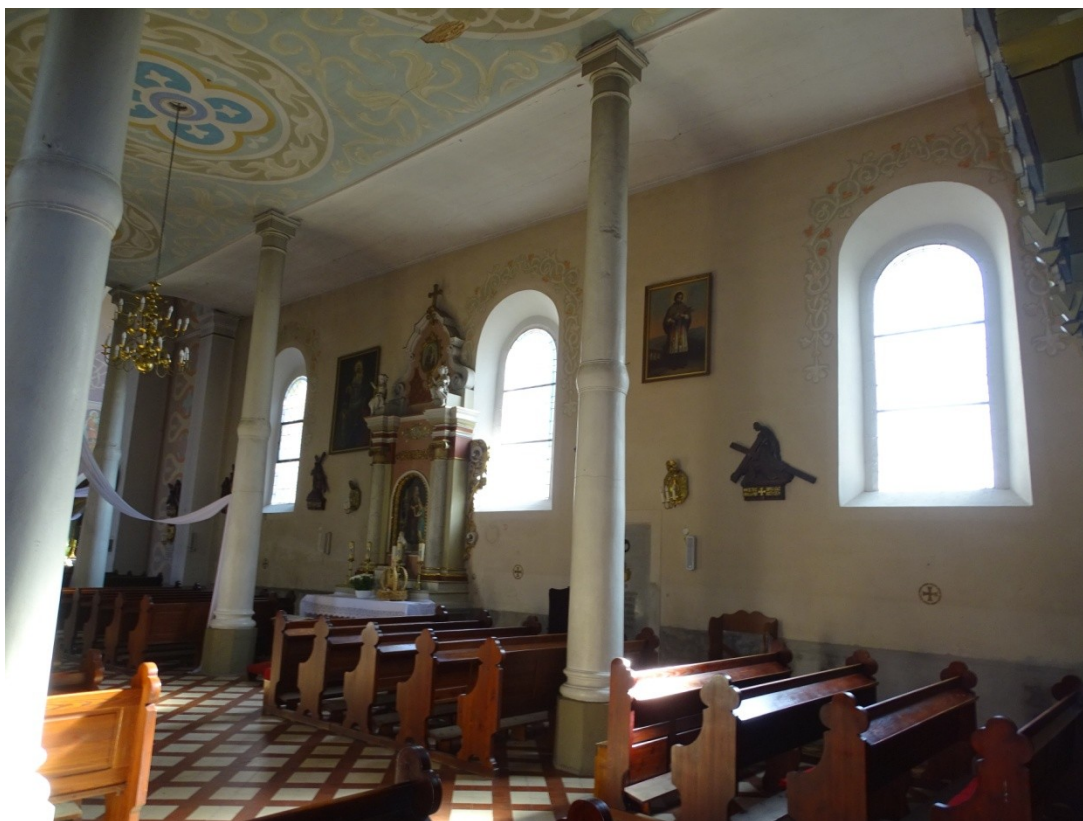
Fot.54 Widok na ścianę południową nawy