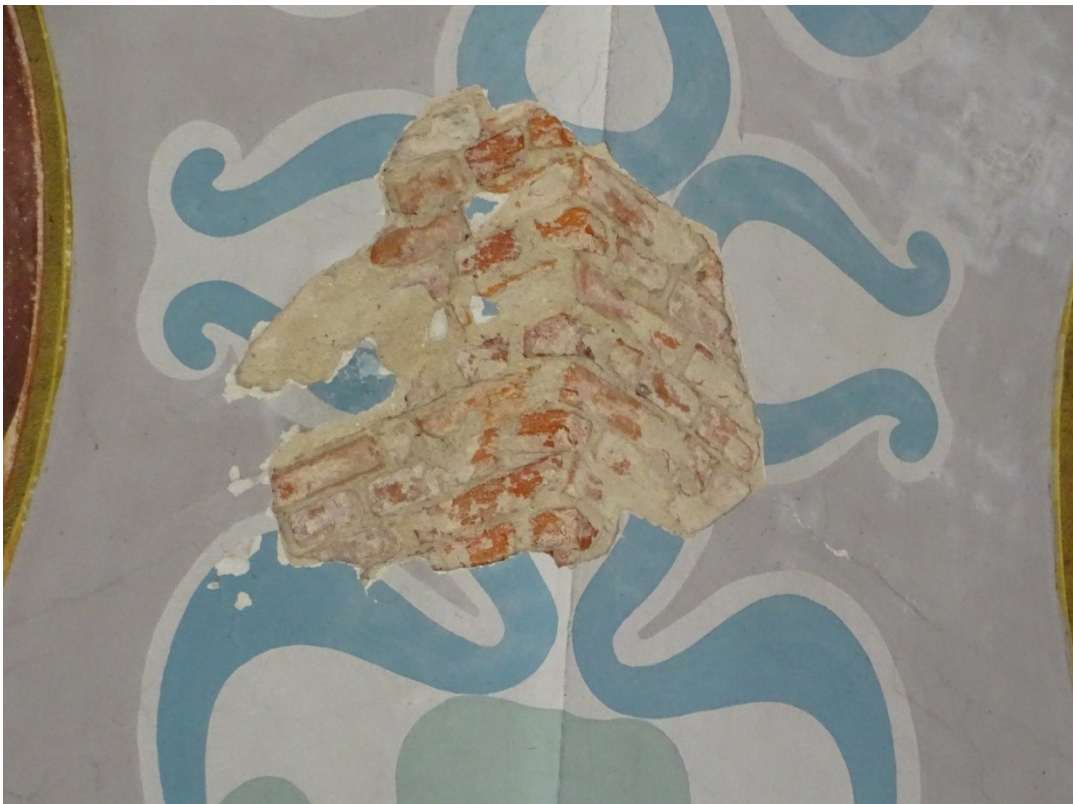
Fot. 9 ubytki tynku na powierzchni malowideł