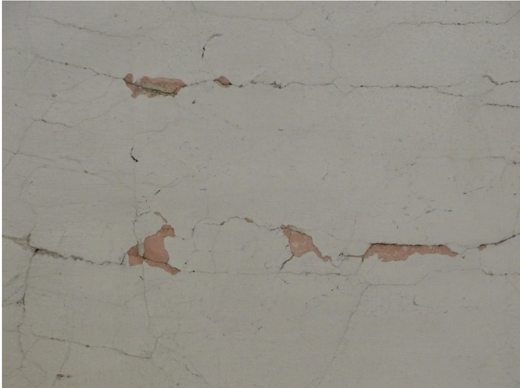
Fot. 22 Odspojenia i ubytki warstw malarskich na sklepieniu nawy