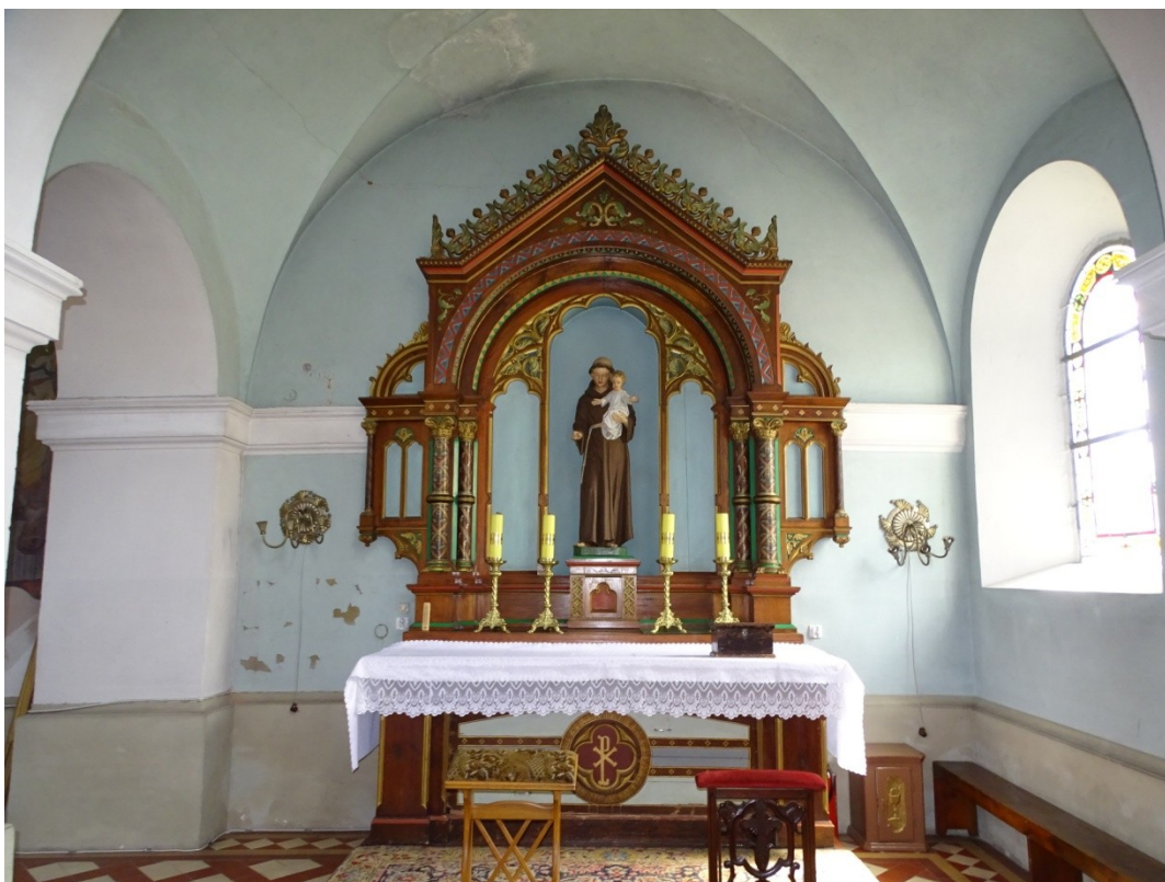
Fot. 60 Widok na ołtarz św. Antoniego w kaplicy południowej