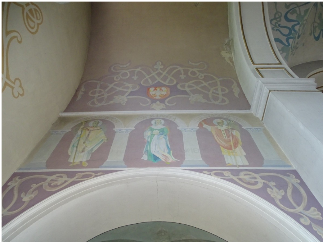
Fot. 11 Zabrudzone i uszkodzone przedstawienia figuralne oraz zacieki i destrukcje tynku