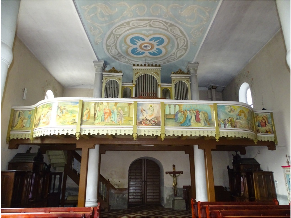
Fot.58 Widok na empore chóru muzycznego i prospekt organowy