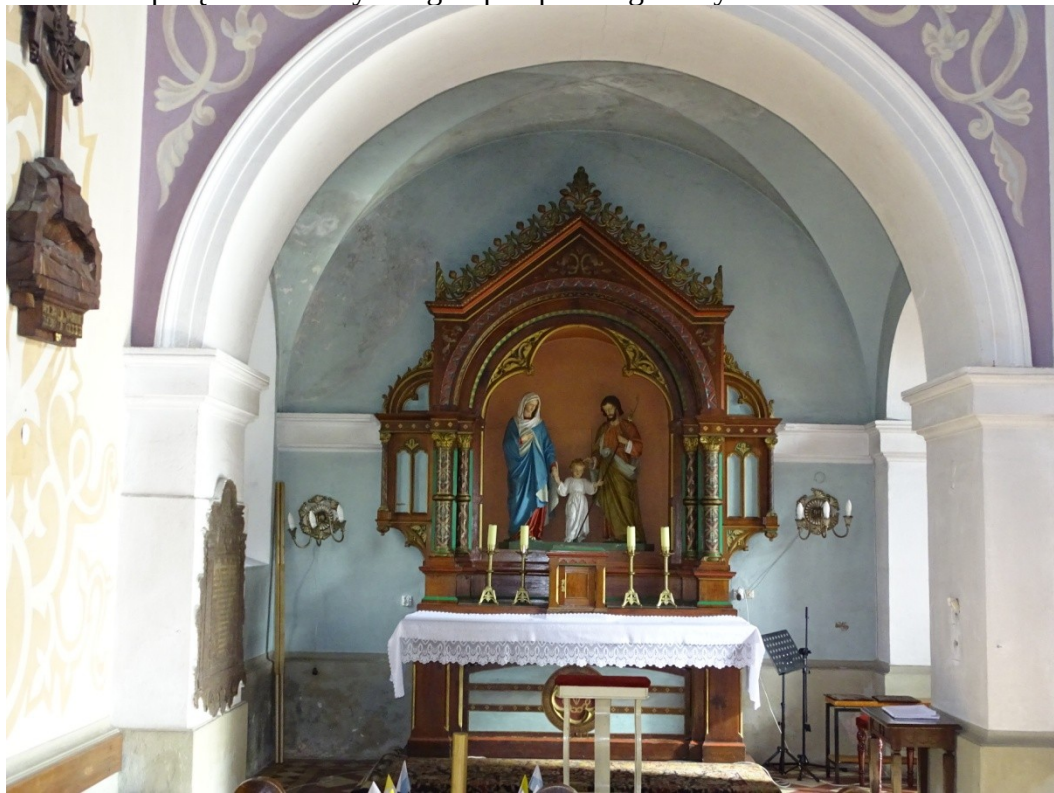
Fot. 59 Widok na ołtarz Świętej Rodziny w kaplicy północnej