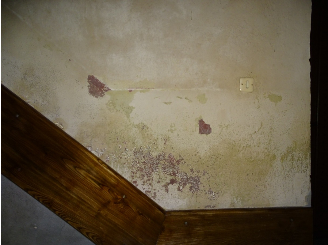
Fot.30 Uszkodzenia i ubytki powstające w sposób mechaniczny