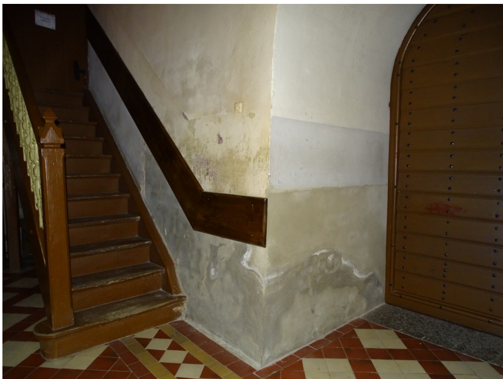
Fot. 28 Uszkodzenia spowodowane zawilgoceniem dolnych partii ścian