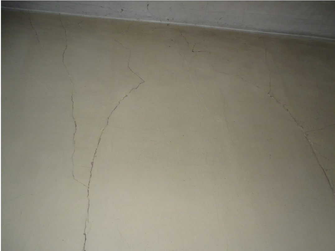
Fot. 18 Lokalne spękania ścian