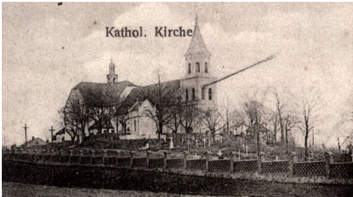
Fot.1 Fotografia z widokiem na kościół początek XX w.