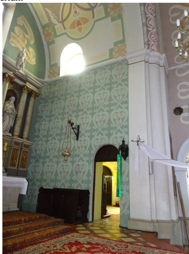
Fot. 35 Widok na aneksy po stronie południowej prezbiterium - zakrystię