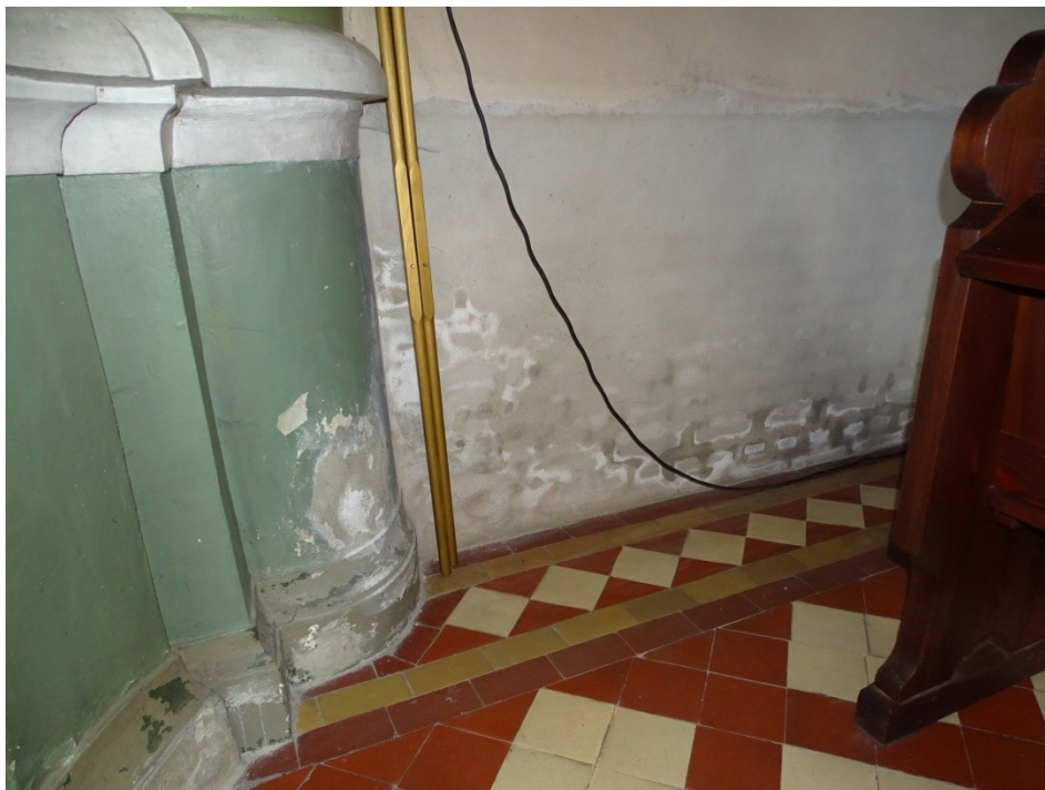
Fot. 25 Uszkodzenia spowodowane zawilgoceniem dolnych partii ścian