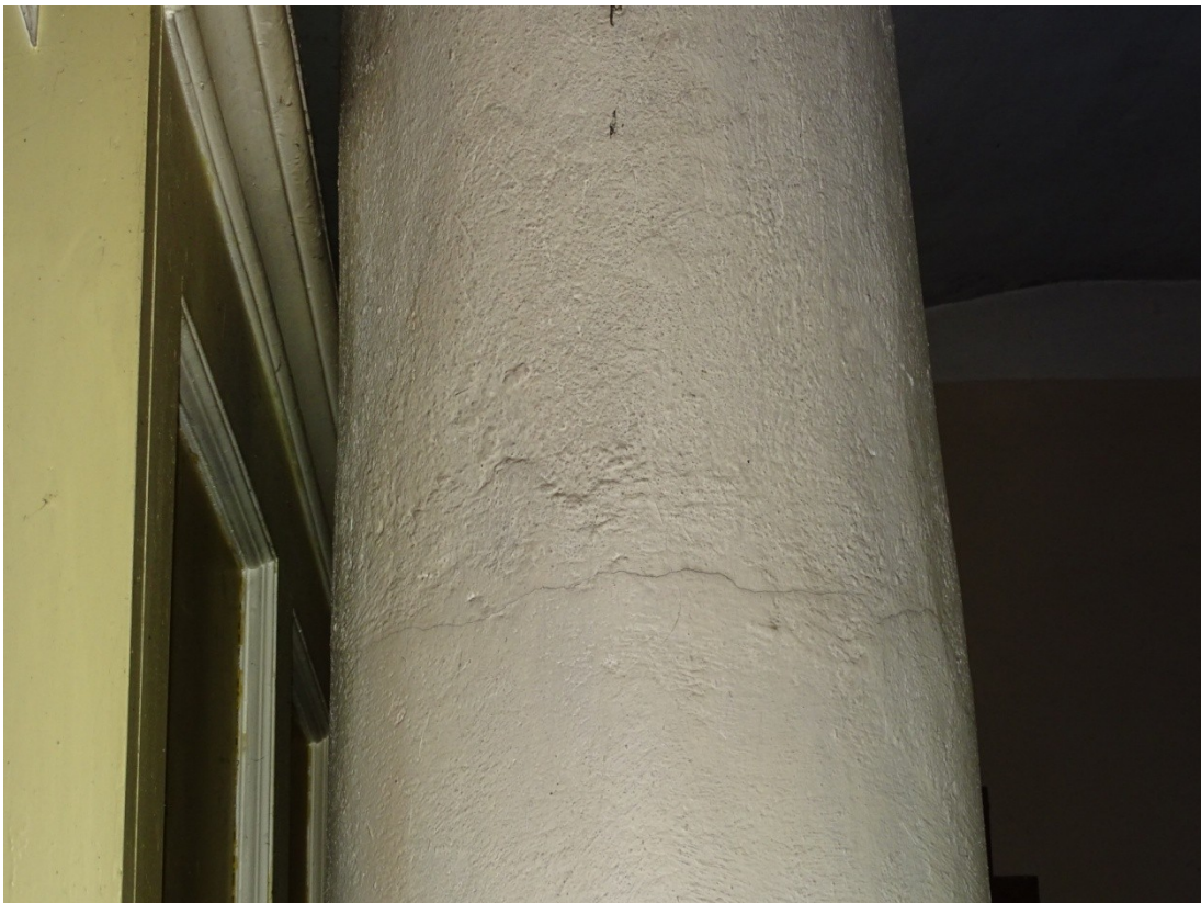
Fot.31 Powierzchnia filarów po wymianie tynków zatartych na ostro