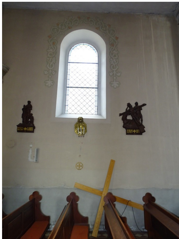
Fot. 7 Zabrudzone i zakurzone ściany nawy głównej