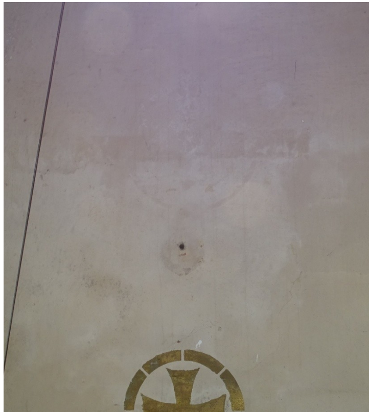
Fot.17 Ślady zamalowanych złożonych zacheuszków