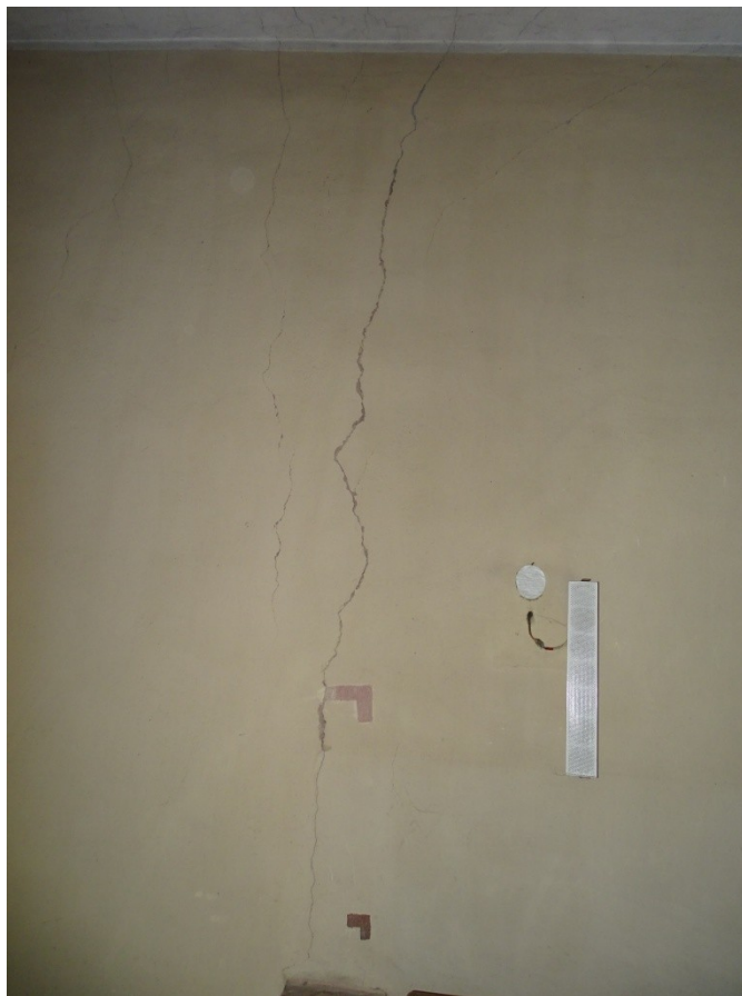
Fot. 21 zarysowania i pęknięcia ścian