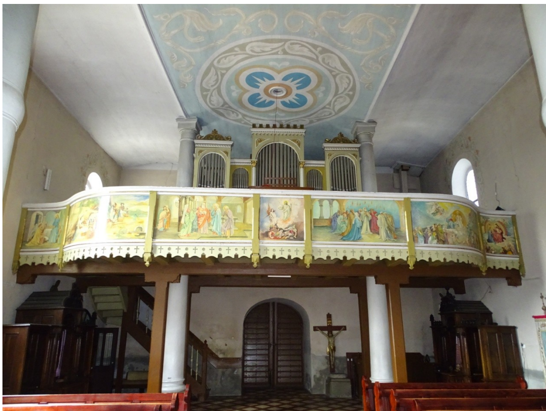
Fot. 6 Zabrudzona i zakurzona część zachodnia