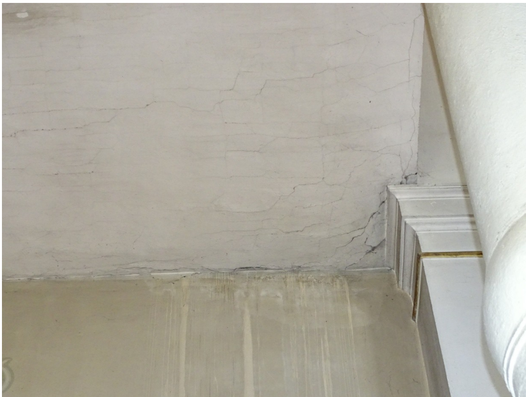
Fot. 19 Pęknięcia w płaszczyźnie sklepień pozornych