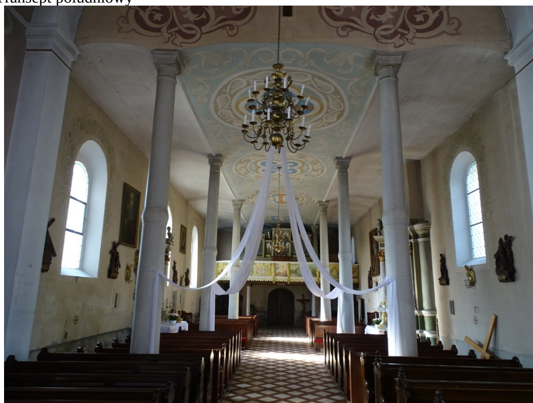
Fot. 51 Widok na zachodnią część naw