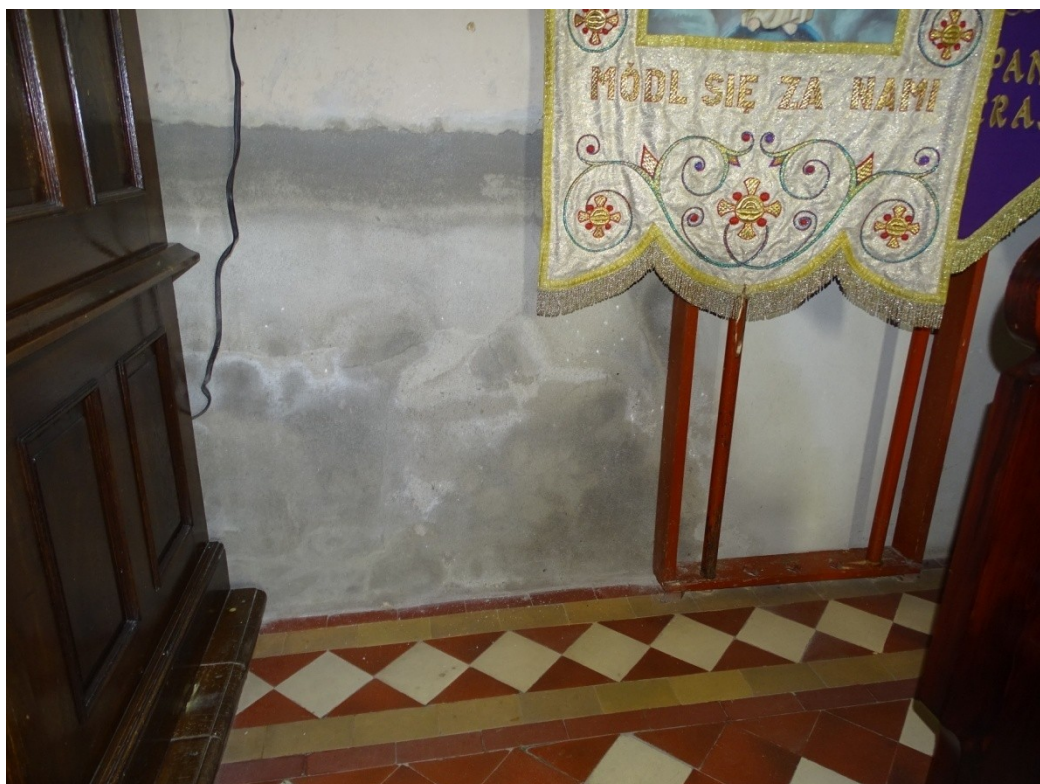
Fot. 29 Uszkodzenia spowodowane zawilgoceniem dolnych partii ścian