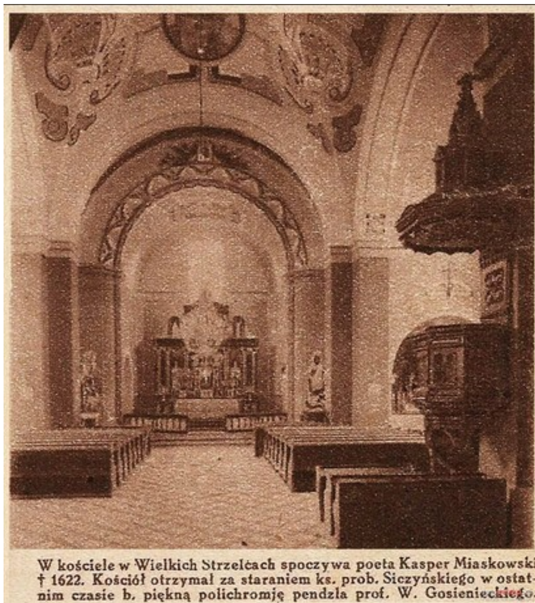
Fot.3 Fragment wnętrza kościoła z polichromią pochodzącą z około 1931 – 1932 r. przed przemalowaniem.