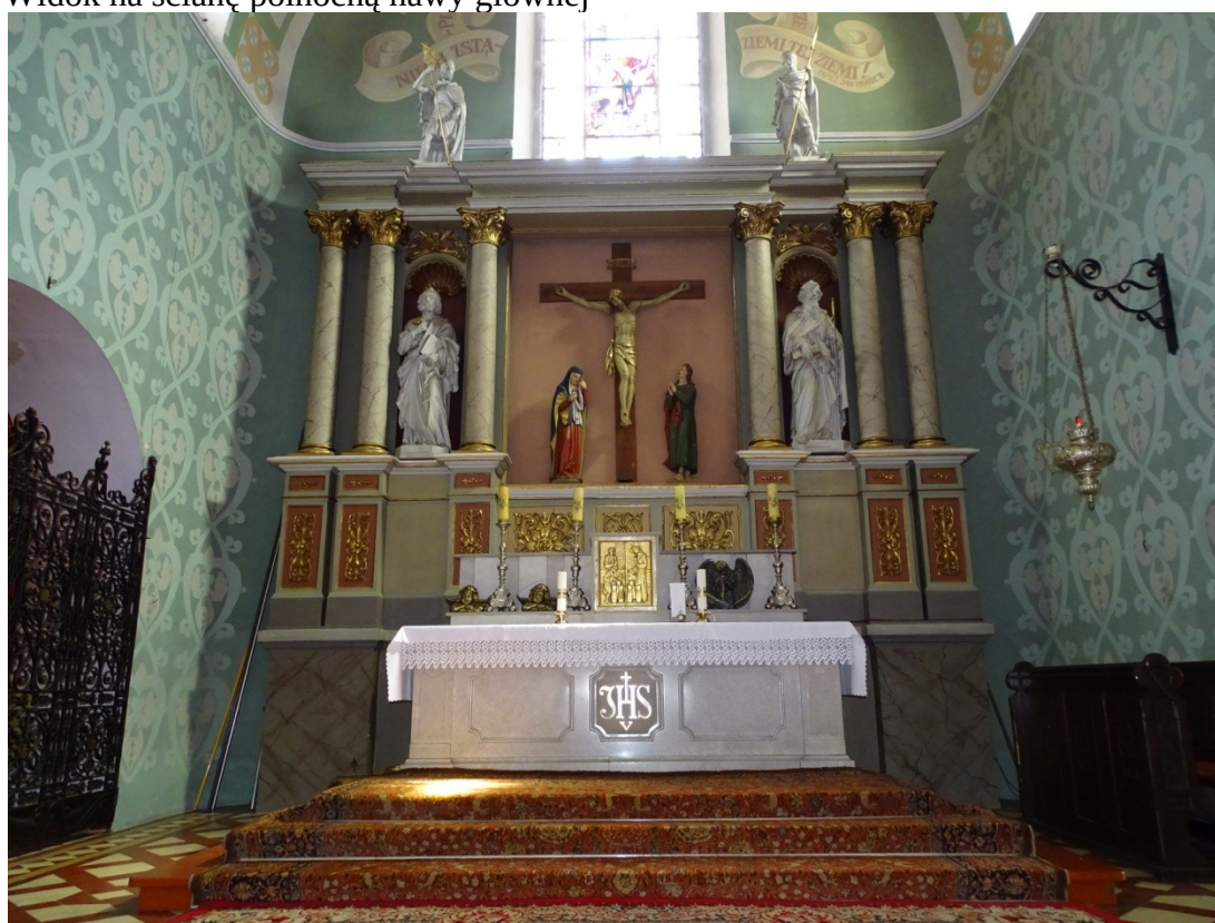
Fot.57 Widok na ołtarz główny