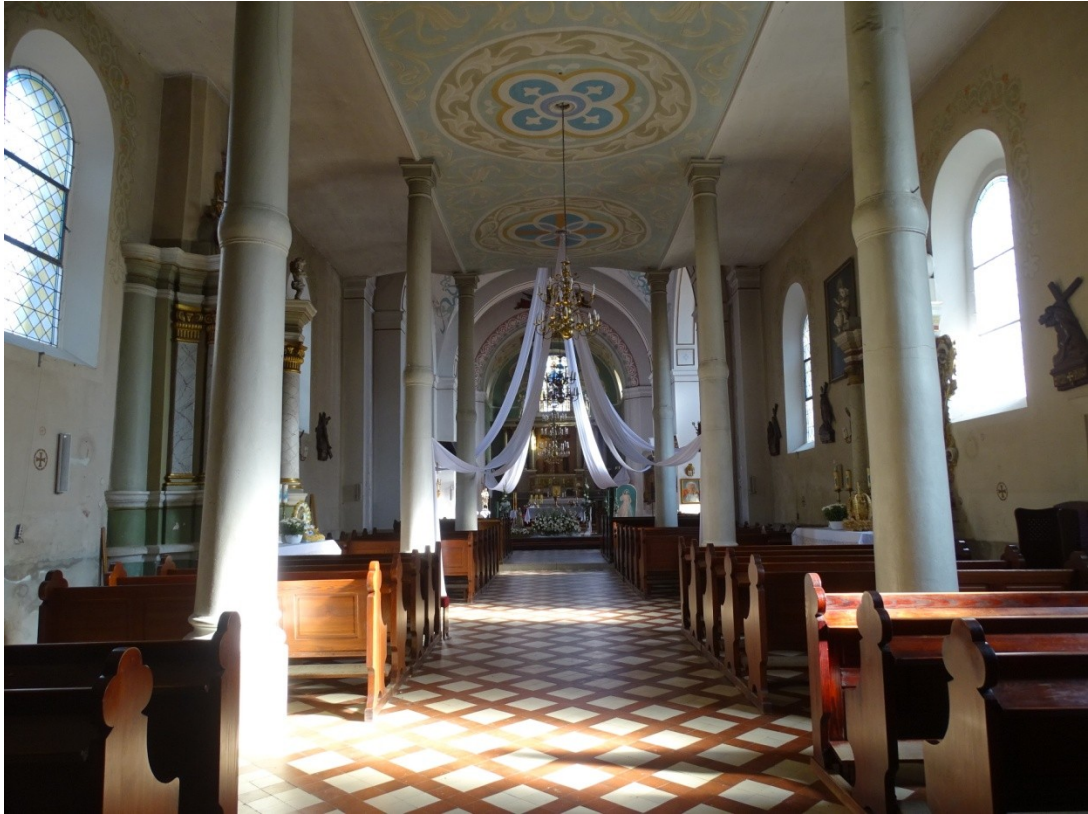
Fot.52 Widok na zachodnią część nawy