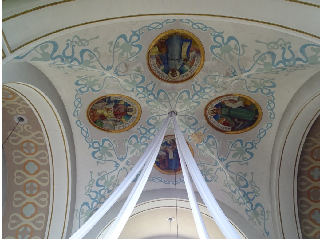
Fot.43 Widok na sklepienie transeptu