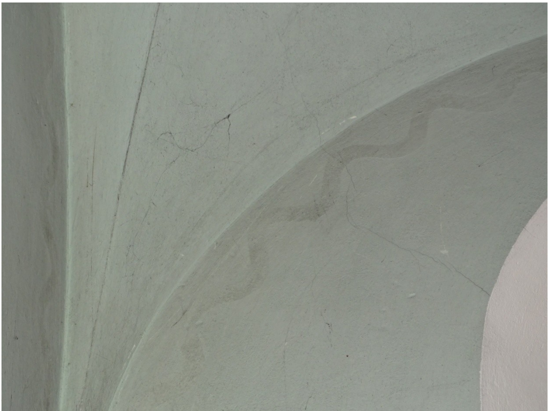
Fot.15 Ślady zamalowanych złoconych dekoracji w kaplicach