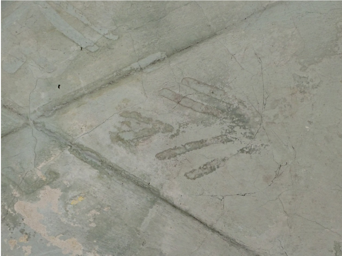
Fot.16 Ślady zamalowanych złożonych dekoracji na sklepieniu kaplic