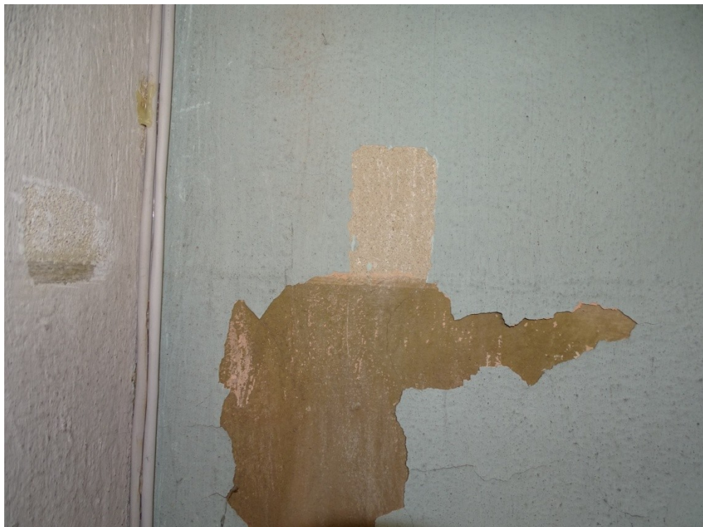
Fot. 23 Odspojenia i ubytki warstw malarskich na ścianach kaplic