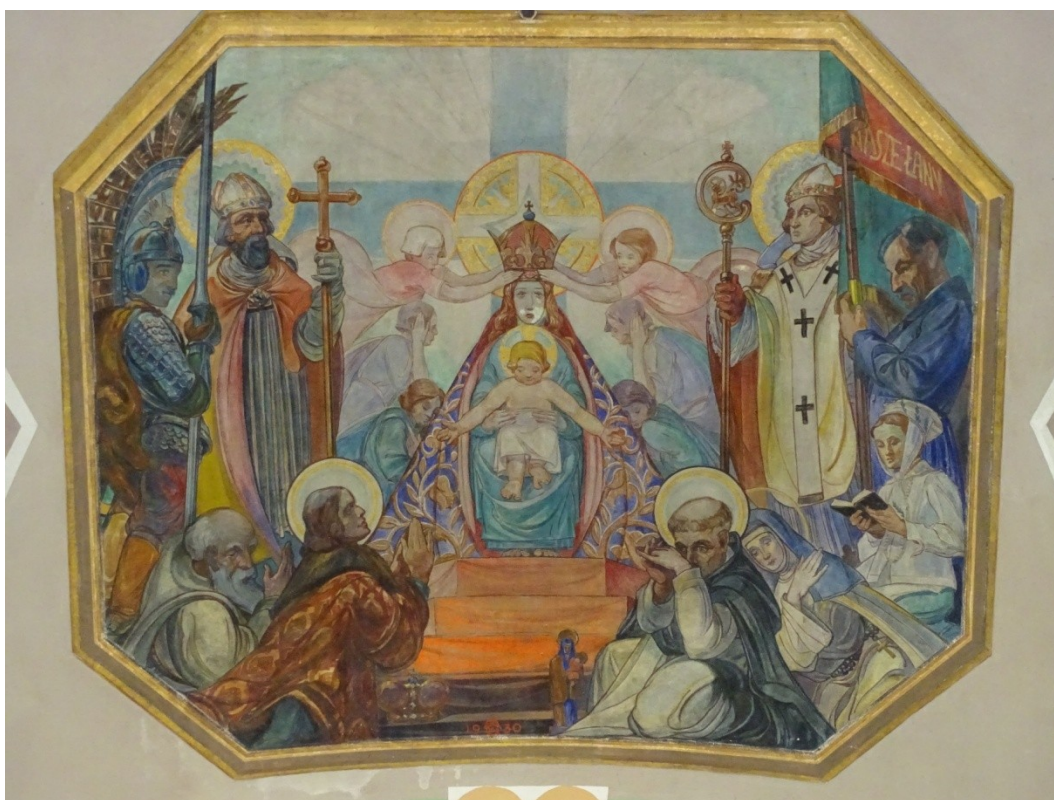
Fot.37 Plafon nad prezbiterium