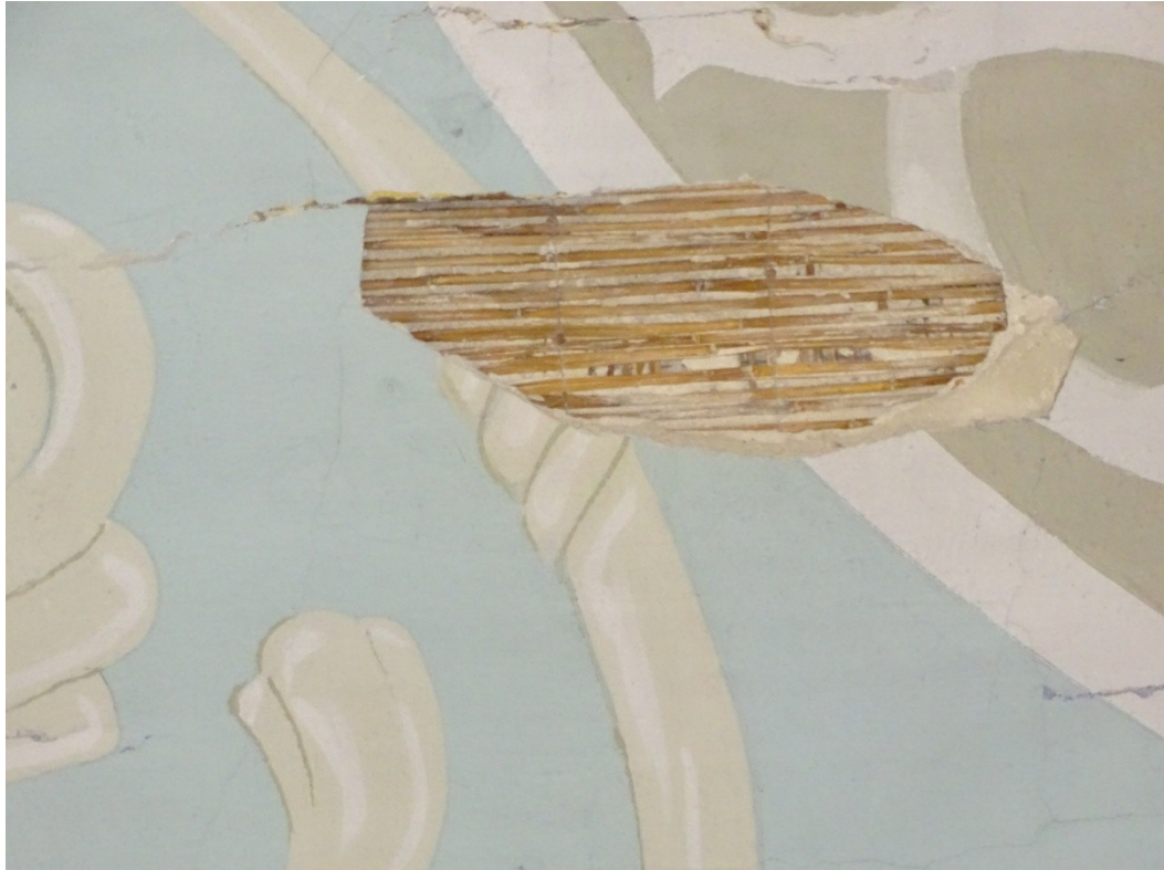
Fot. 12 Ubytki tynku na sklepieniu pozornym nawy głównej