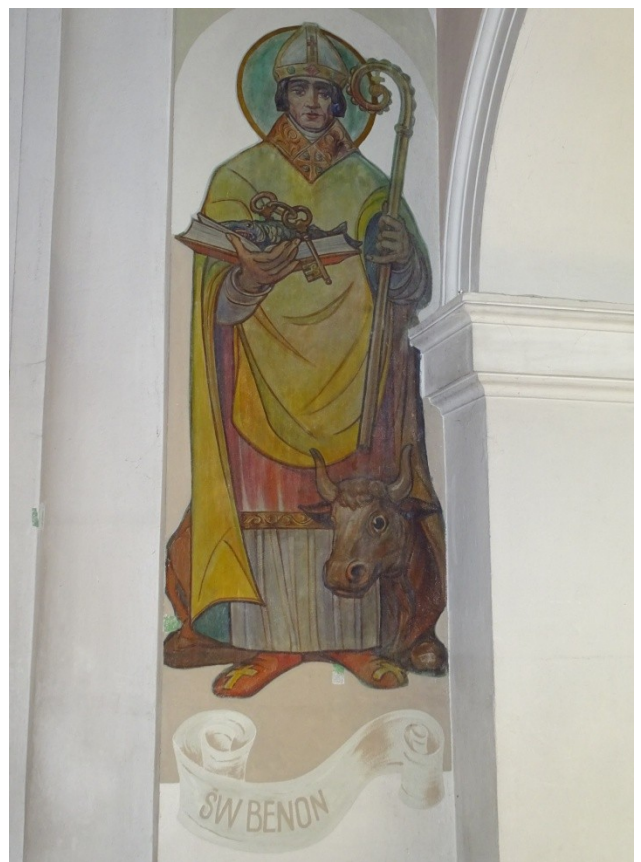
Fot. 39,40 Malowidła figuralne przy łuku tęczowym