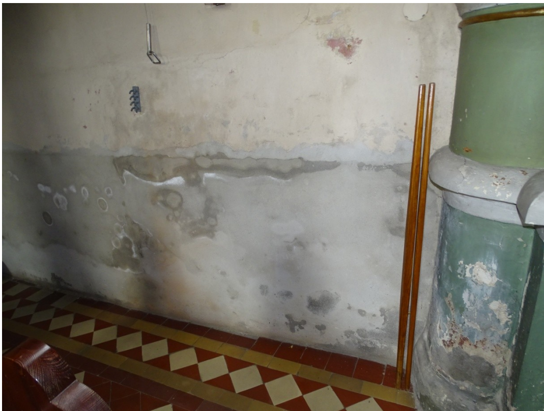
Fot. 26 Uszkodzenia spowodowane zawilgoceniem dolnych partii ścian