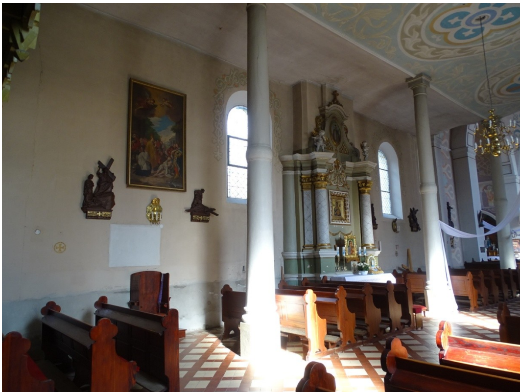
Fot.53 Widok na ścianę południową nawy