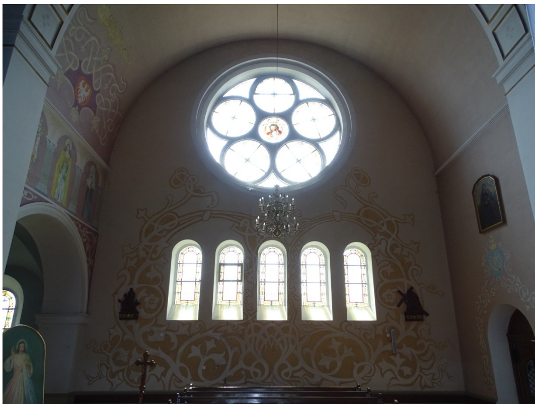
Fot. 50 Transept południowy