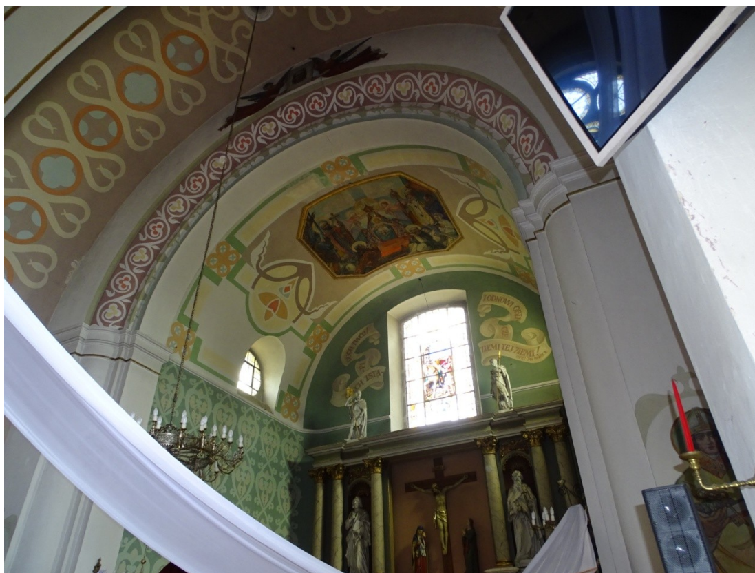
Fot. 5 Zabrudzona i zakurzona część prezbiterium