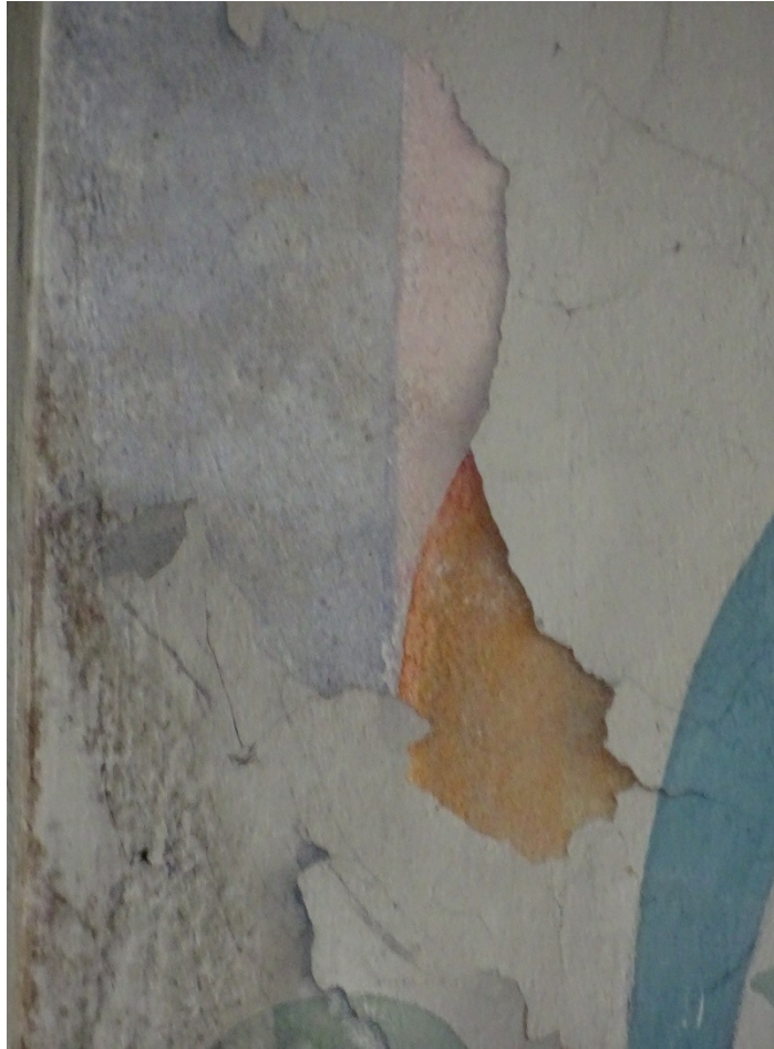
Fot. 24 Odspojenia i ubytki warstw malarskich na sklepieniu transeptu