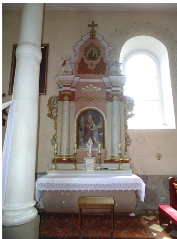
Fot. 61 Widok na ołtarz św. Anny po stronie południowej nawy