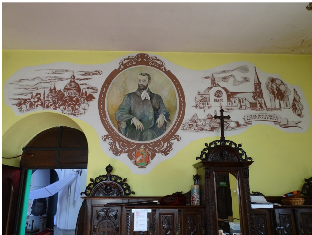
Fot. 41 Widok na część północną zakrystii