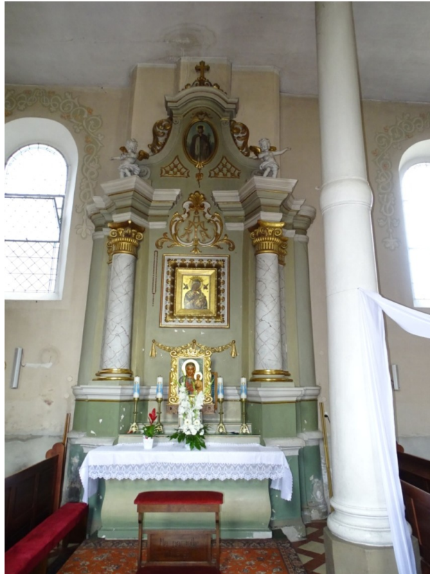
Fot.62 Widok na ołtarz MB Nieustającej Pomocy po stronie północnej nawy