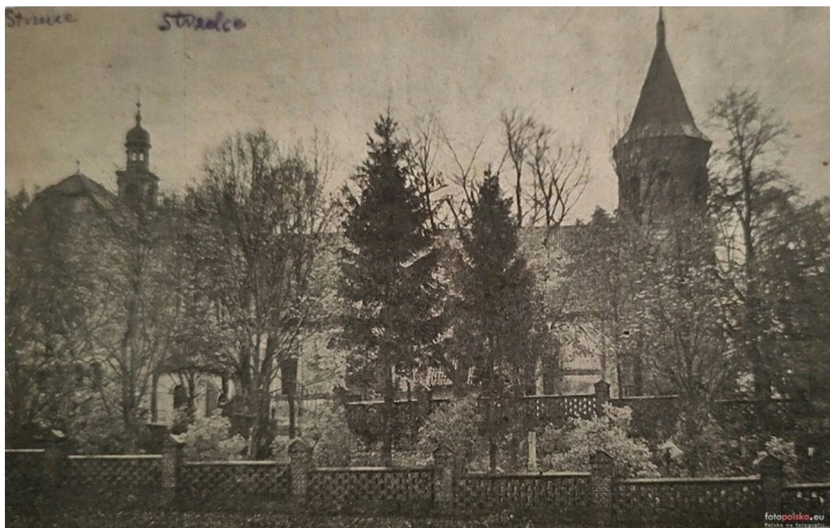
Fot.2 Fotografia z widokiem na kościół z 1931 roku