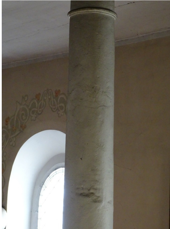
Fot.32 Powierzchnia filarów po wymianie tynków zatartych na ostro