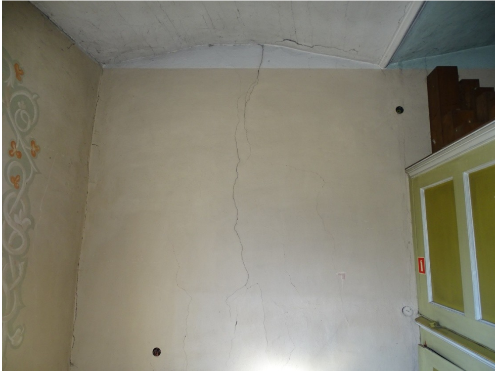
Fot. 20 Pęknięcia w płaszczyźnie ścian i sklepień pozornych