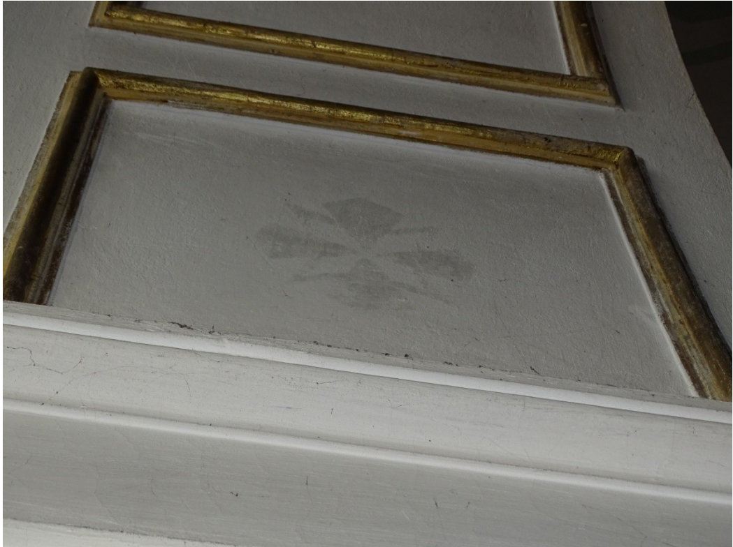
Fot.14 Ślady zamalowanych złoconych dekoracji na podłuczach arkad transeptu