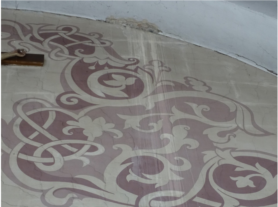
Fot. 10 Malowidła uszkodzone przez występujące zacieki i destrukcje tynku