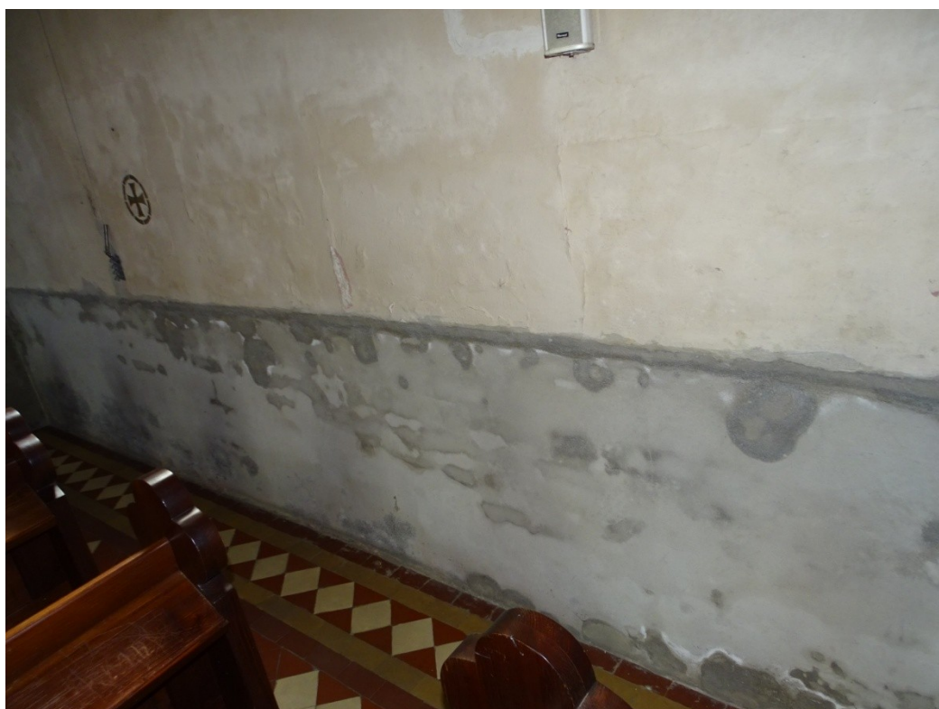
Fot. 27 Uszkodzenia spowodowane zawilgoceniem dolnych partii ścian