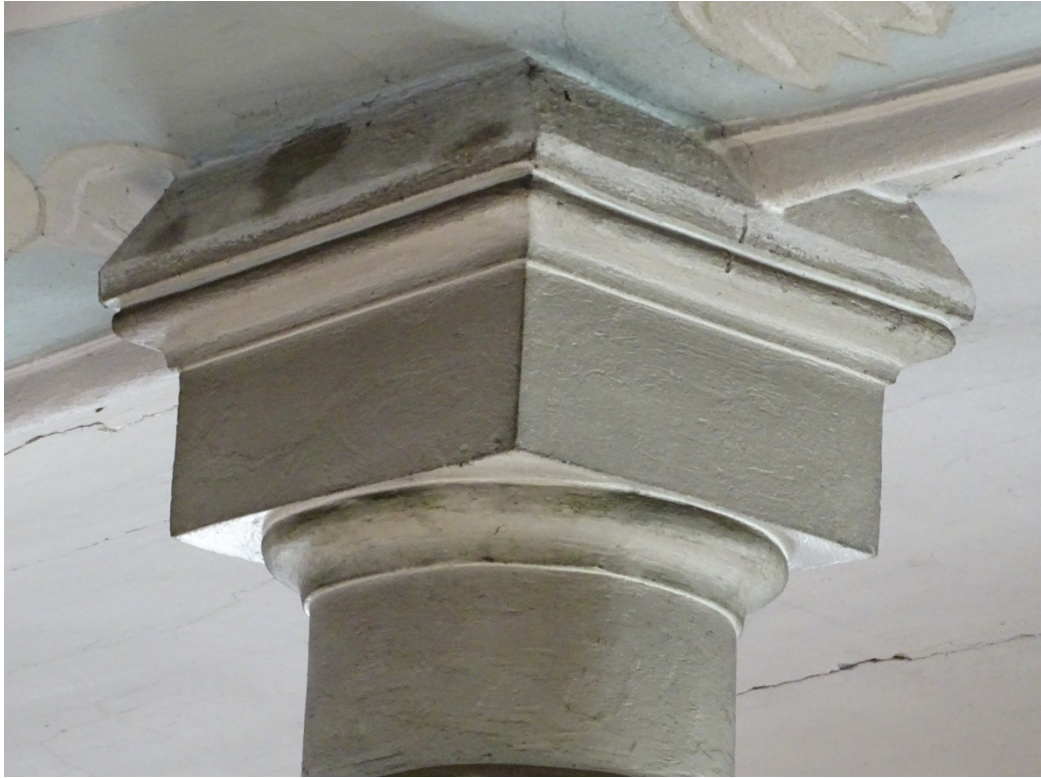
Fot. 8 Zabrudzony i zakurzony detal architektoniczny kościoła