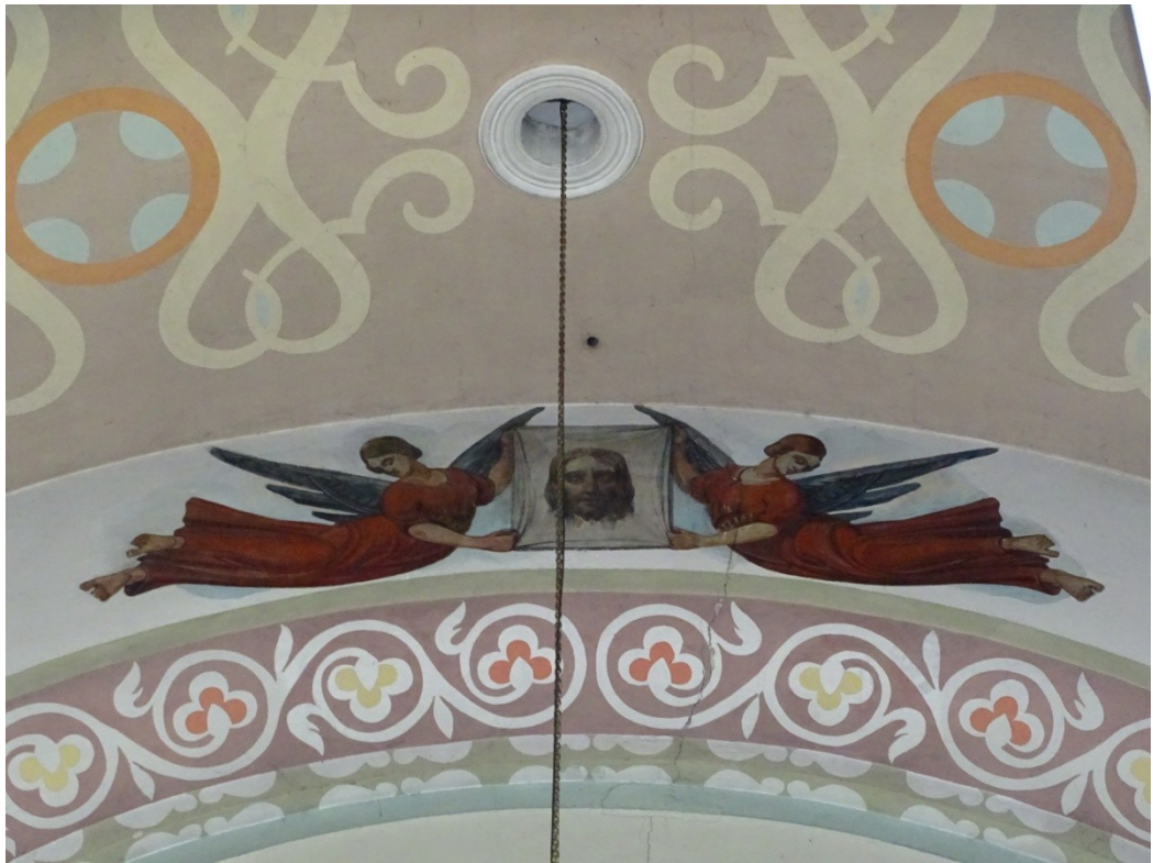
Fot.38 Malowidło nad łukiem tęczowym