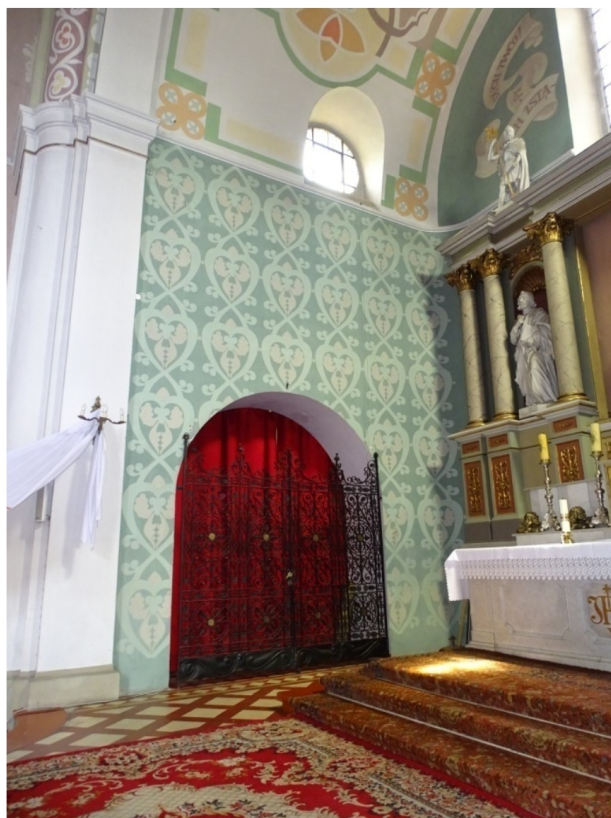
Fot. 36 Widok na aneksy po stronie północnej prezbiterium – lożę kolatorską