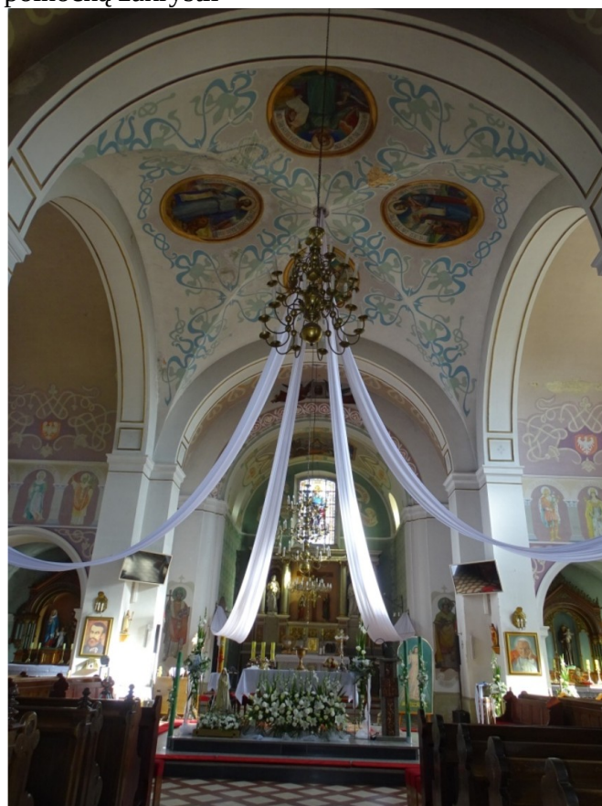
Fot.42 Widok ogólny na transept