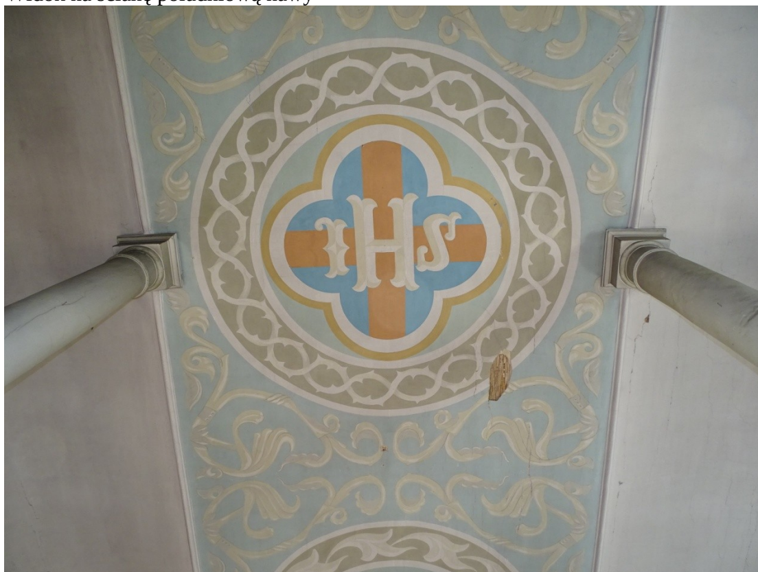
Fot.55 Widok na stropę naw